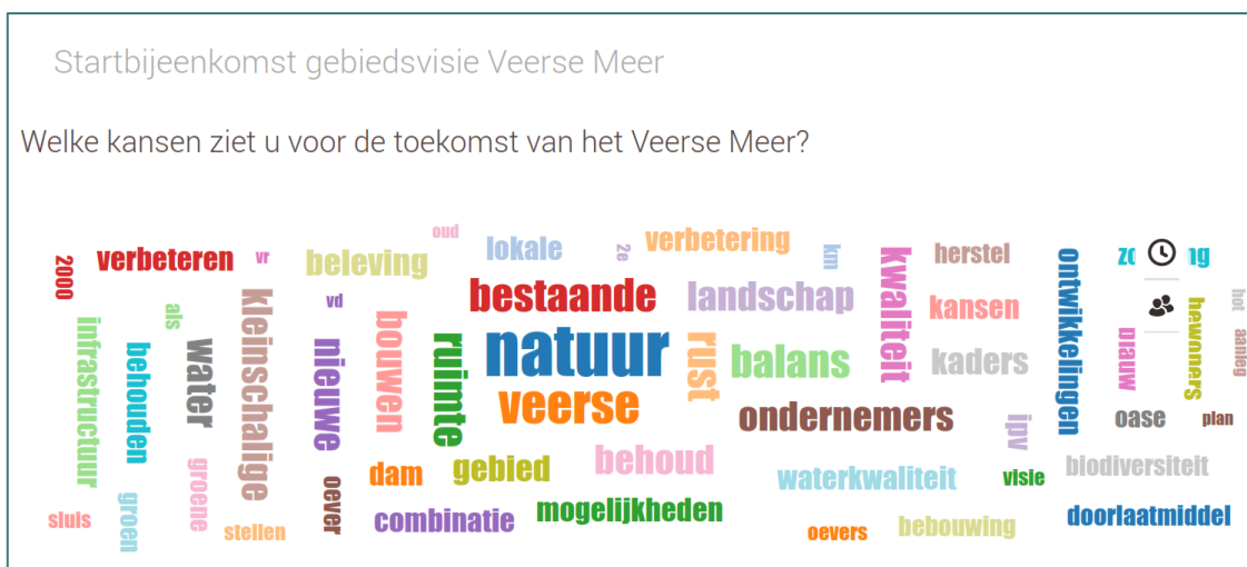
Figuur 2: Wordle van door de deelnemers benoemde kansen